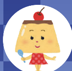
安藤 茜 (どんどん)